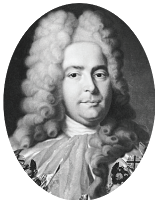
Генерал-прокурор Павел Иванович Ягужинский